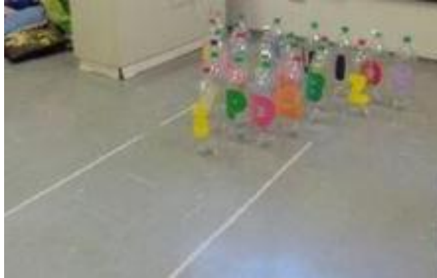
IMAGEM: PORTALDOPROFESSOR.MEC ACESSO EM 21/07/2020